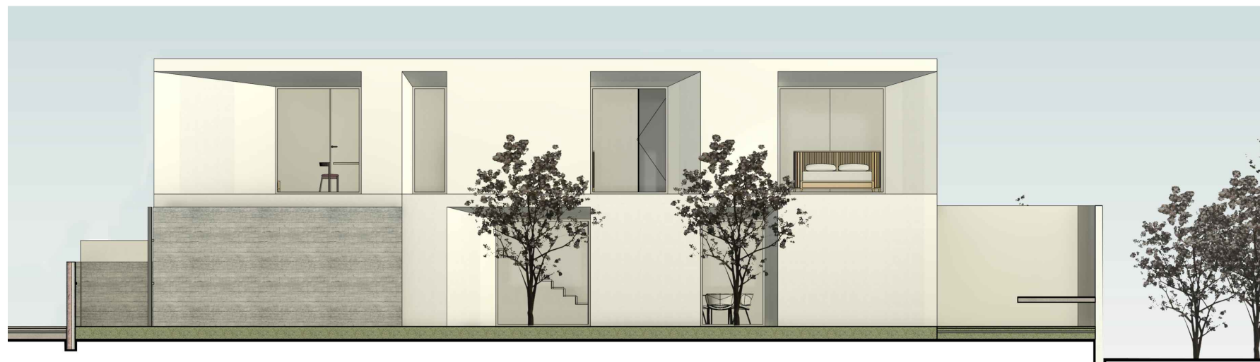
Alçado Lateral Drt. B2