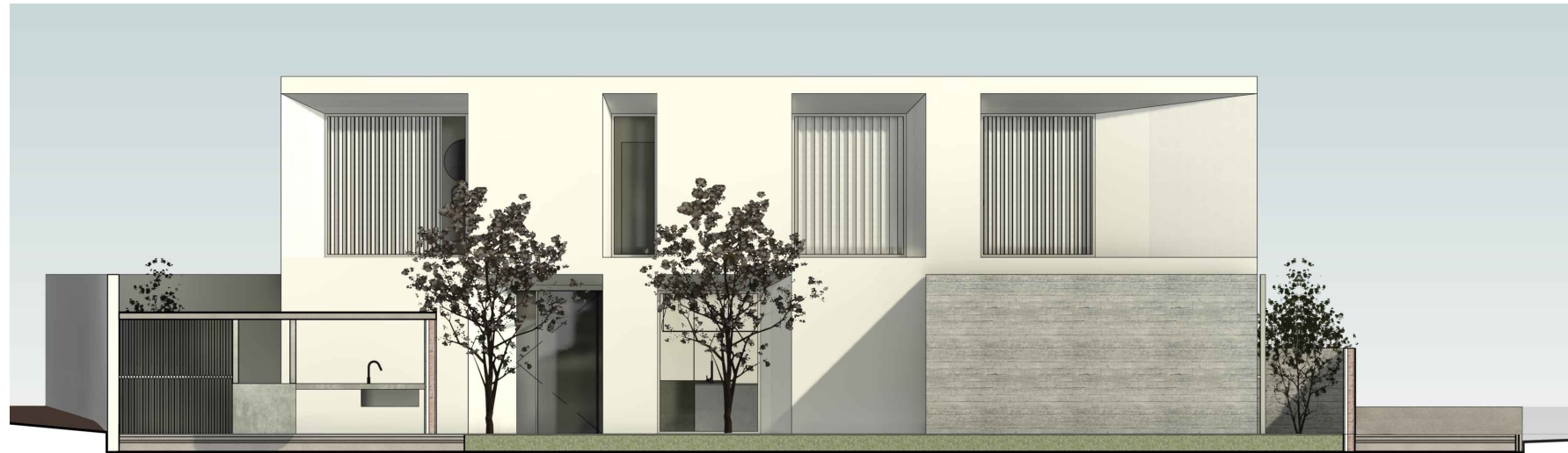
Alçado Lateral A1