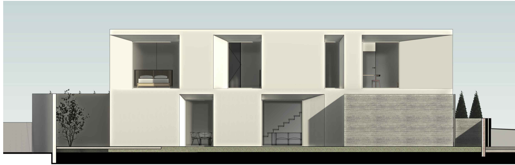
Alçado Lateral Esq. B1